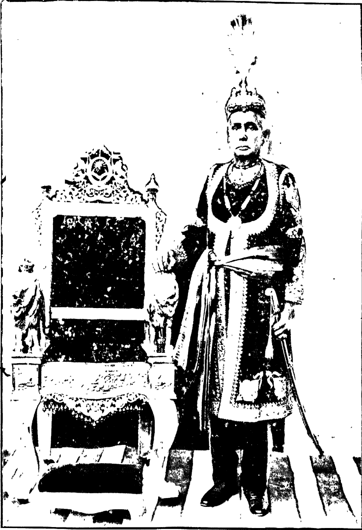
श्री श्री श्री जयपुरसंस्थानाधीश्वर साहित्यसम्राट् श्रीविक्रमदेववर्मा